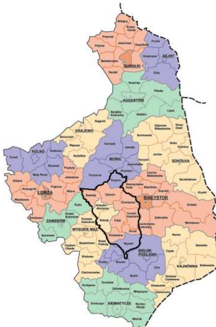
Mapa 1. LGD N.A.R.E.W. na tle województwa podlaskiego

Spójność obszaru LGD jest w największym stopniu związana z doliną Narwi i jej naturalnym środowiskiem oraz bogactwem przyrodniczym, zachowanym w naturalnym, pierwotnym kształcie. Spójność geograficzna, w tym głównie przyrodnicza obszaru wpływa na spójność historyczną, ekonomiczną oraz kulturowo-społeczną tego obszaru.