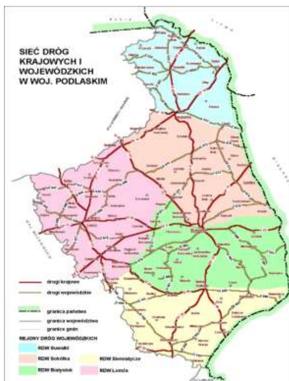
Mapa 3. Sieć dróg krajowych i wojewódzkich w woj. podlaskim

Równie ważną osią komunikacyjną jak droga krajowa nr 8 jest linia kolejowa Białystok-Warszawa, biegnąca m.in. przez Łapy i Czyżew. Pełni ona dla mieszkańców obszaru LGD N.A.R.E.W. istotną rolę zarówno w komunikacji ze stolicą województwa, jak i Warszawą. Linia biegnie przez gminy: Choroszcz, Turośń Kościelna, Łapy, Poświętne i Sokoły.