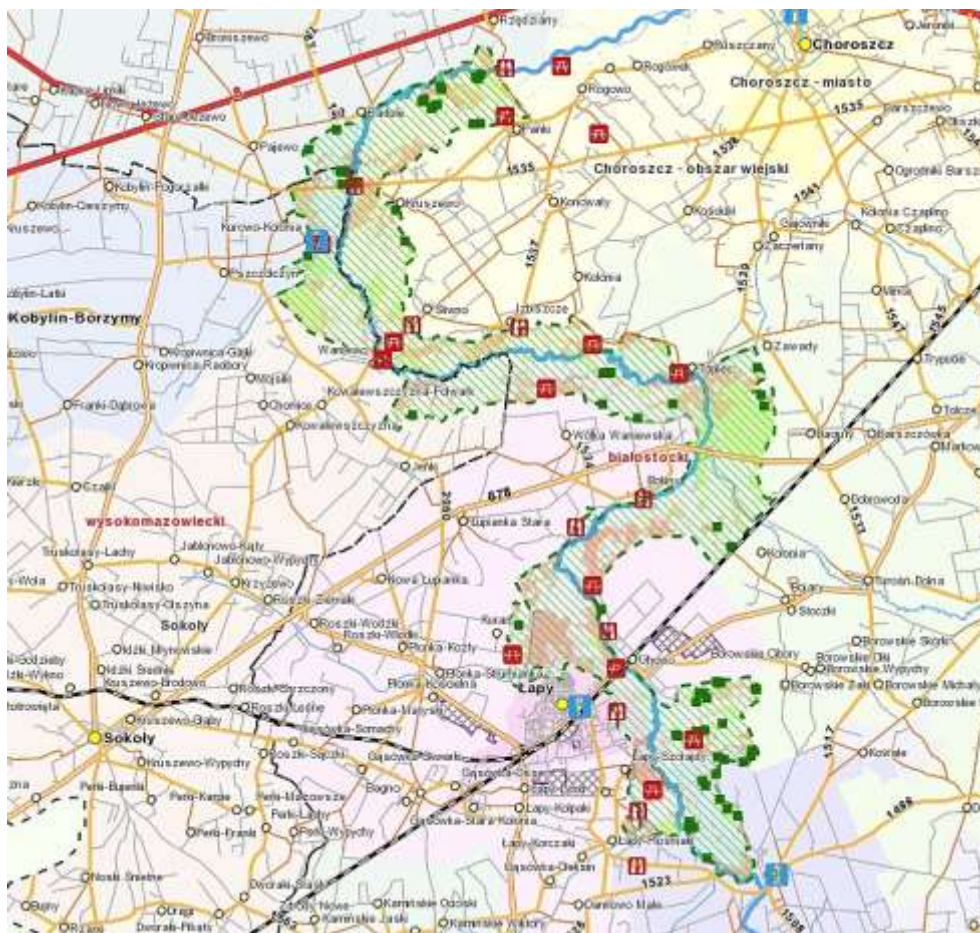
Mapa 2. Narwiański Park Narodowy

Dolina Górnej Narwi, a szczególnie jej odcinek w granicach Stowarzyszenia N.A.R.E.W., wykształciła się w obrębie dość szerokiego i niezbyt głębokiego obniżenia terenu. Dolina Górnej Narwi zajmuje powierzchnię ok. 480 km 2 . Składa się z trzech zasadniczych części, a najciekawsza i najbogatsza przyrodniczo jej część to środkowy fragment rzeki, położony na obszarze LGD N.A.R.E.W., od Suraża do Żółtek. Te tereny doliny rzecznej bywają nazywane „Polską Amazonią” i są osobliwością przyrodniczą Polski i Europy.