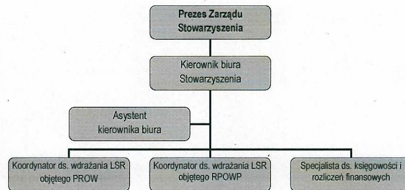
Rysunek 1. Podział stanowisk

W celu właściwego funkcjonowania Stowarzyszenia utworzone jest Biuro, które kieruje pracami organizacyjnymi i przygotowawczymi (§ 24 Statutu). Szczegółowy podział zadań poszczególnych pracowników biura, wymagania konieczne i pożądane adekwatne do przewidzianych obowiązków wraz z zakresem uprawnień i obowiązków został opisany w „Opisach stanowisk pracy określających konieczne i pożądane kwalifikacje i doświadczenia zawodowe, zakres obowiązków, uprawnień i odpowiedzialności na poszczególnych stanowiskach adekwatnych do wymagań koniecznych i pożądanych” stanowiący Załącznik nr 1 do Regulaminu biura Stowarzyszenia (Regulamin Biura załączono do Wniosku o wybór LSR). Biuro LGD zatrudni 5 pracowników etatowych, zgodnie z rozporządzeniem dot. wsparcia na rzecz kosztów bieżących i aktywizacji. Na dzień składania LSR min. 50% pracowników zatrudnionych w biurze przy wdrażaniu Lokalnej Strategii Rozwoju posiada doświadczenie i niezbędną wiedzę do wdrażania i aktualizacji dokumentów o strategicznym zasięgu regionalnym lub lokalnym. Ponadto opracowana została procedura naboru pracowników do biura stanowiąca Załącznik nr 2 do Regulaminu biura. Struktura Biura (zgodnie z Regulaminem biura Stowarzyszenia) zakłada następujący podział stanowisk i obowiązków: